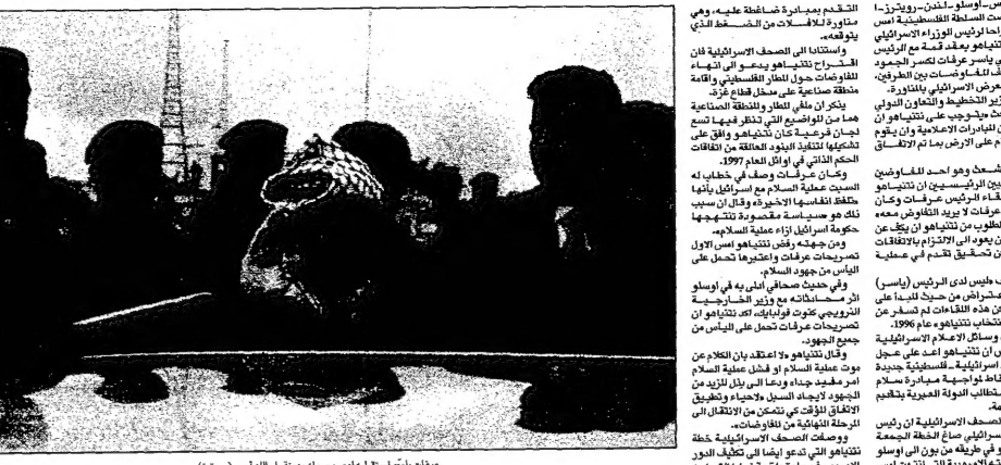
عزرايت بن نطيف، رئيسة الوزراء، ومحمد عوض، وزير الخارجية، في اجتماع مع رئيس الوزراء، يئزر رابين، في القدس.

القدس- اوسلو- أعلن وزير الخارجية الإسرائيلي، يئزر رابين، في بيان مقتضب عقب مقتل عسكري اسرائيلي اثنان من اثنين من مقاتلي المقاومة الفلسطينية في لبنان، في احدى عملياتها القتالية، قال الجيش الاسرائيلي ان الاثنين قتلوا في عملية عسكرية نفذتها القوات الاسرائيلية في منطقة النبطية في لبنان.